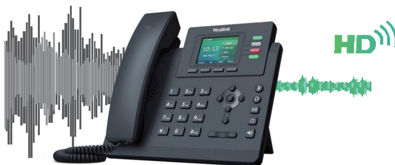
Filtragem inteligente de ruído

A série Yealink T3 oferece comunicações sem distrações com a tecnologia de filtragem inteligente de ruído líder do setor, que proporciona uma excelente qualidade de som sem ruídos extrínsecos e permite conversas fluidas.